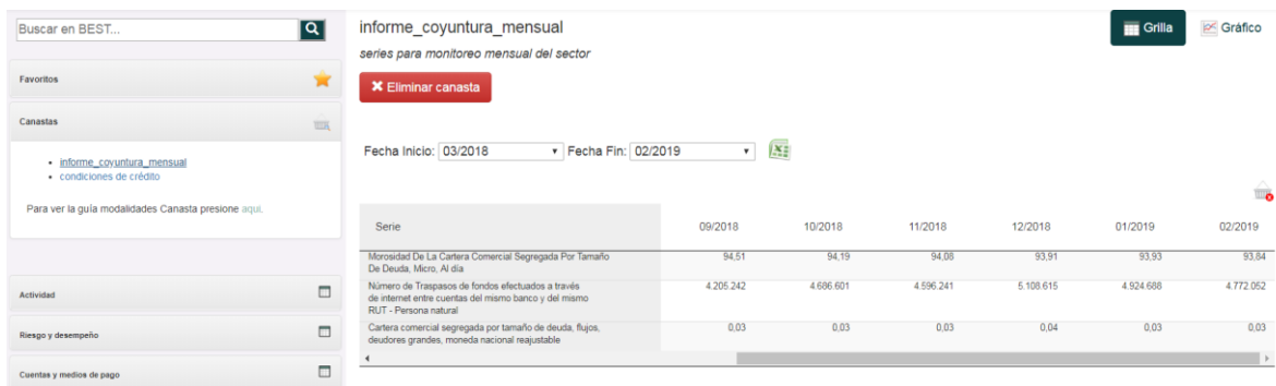
Figura 7 – Visualización Canasta Gráfico